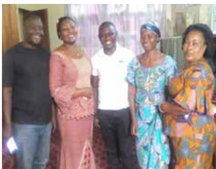
Voix Libres - Afia-Fev, Congo Kivu