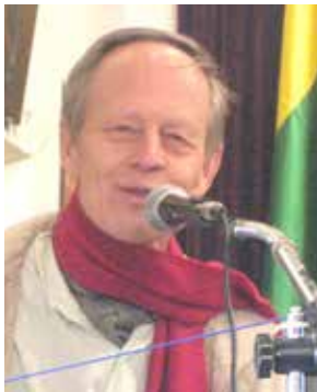
Reino - Voix Libres Blois et Voix Libres Finlande