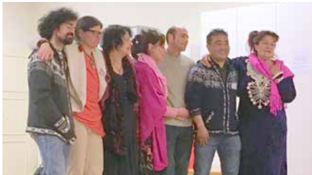
Voix Libres Genève