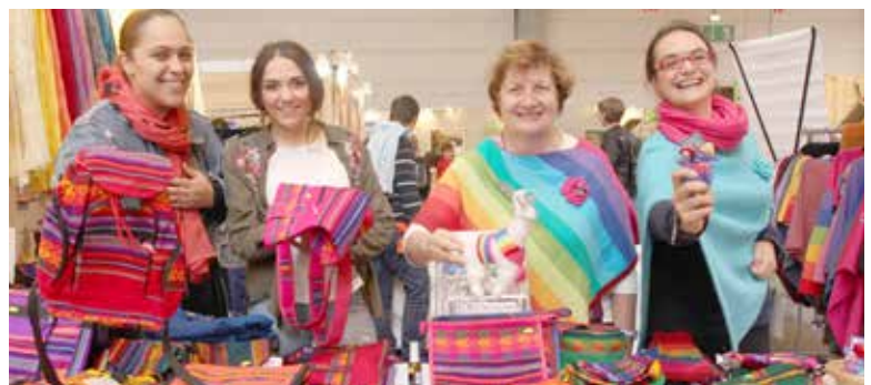
Voix Libres Strasbourg