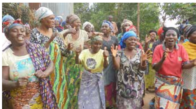
Le chant après les micro-crédits!