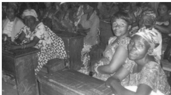
Avant... les survivantes du Kivu...

Aujourd'hui, 250 femmes bénéficient de nos micro-crédits et peuvent enfin nourrir leurs enfants!