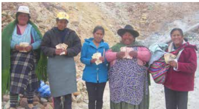
Elles ne sont plus paralysées de peur et respirent enfin!